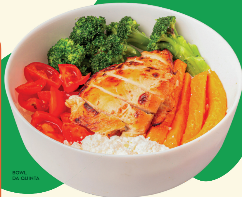
BOWL DA QUINTA

Frango crocante, arroz thai jasmim com molho creamy piri-piri, cubos de abacate, cream cheese, brócolos, cebola roxa, chips de batata-doce e molho poke.